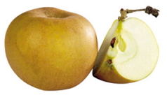
exemple : pomme