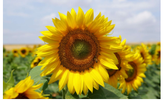
exemple : tournesol