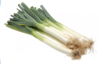
exemple : poireau