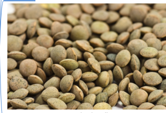
exemple : lentilles

eau : 3,38 glucides : 10,1 lipides : 21,3 protéines : 55,5 fibres : 6,4