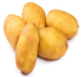
exemple : pomme de terre